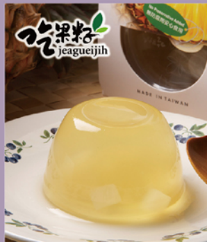
吃果籽 鮮果汁 鳳梨椰果凍

規格：100g/杯,4杯/盒,2盒/袋 熱量：85.7大卡/100g 保存期限：常溫365天