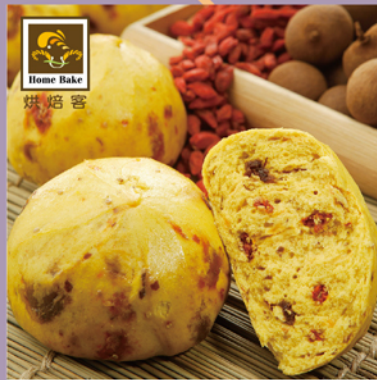
烘焙客 SoQ 枸杞桂圓饅頭

規格：65g/顆×12 熱量：263大卡/100g 保存期限：-18°C冷凍1年