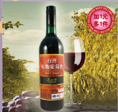
此商品無參加任選2件95折活動