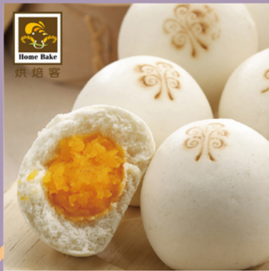
烘焙客 SoQ 奶皇包

規格：32g/顆×16 熱量：264大卡/100g 保存期限：-18°C冷凍1年