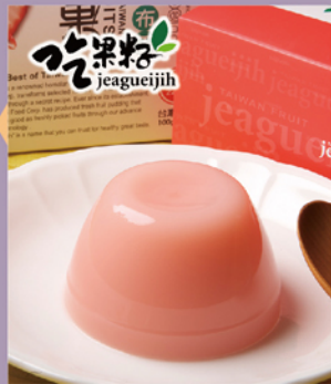
吃果籽 鮮果汁 草莓布丁凍

規格：100g/杯,4杯/盒,2盒/袋 熱量：90.5大卡/100g 保存期限：常溫365天