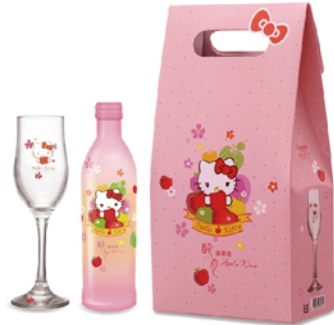
此商品無參加任選2件95折活動