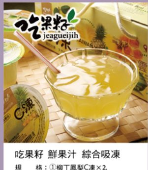
吃果籽 鮮果汁 綜合吸凍

規格：①柳丁鳳梨C凍×2, ②蜂蜜檸檬C凍×2, ③文旦香柚C凍×2 熱量：①65.6大卡/100g, ②50.8大卡/100g, ③59.6大卡/100g 保存期限：常溫365天