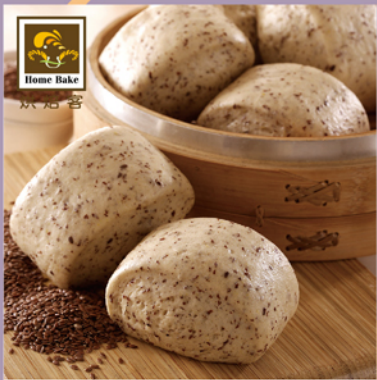
烘焙客 有機亞麻仁饅頭

規格：75g/顆×12 熱量：207.9大卡/100g 保存期限：-18°C冷凍1年