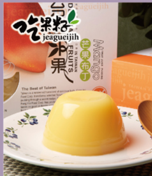
吃果籽 鮮果汁 芒果布丁凍

規格：100g/杯,4杯/盒,2盒/袋 熱量：87.3大卡/100g 保存期限：常溫365天