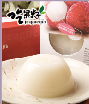
吃果籽 鮮果汁 荔枝布丁凍

規格：100g/杯,4杯/盒,2盒/袋 熱量：91.2大卡/100g 保存期限：常溫365天