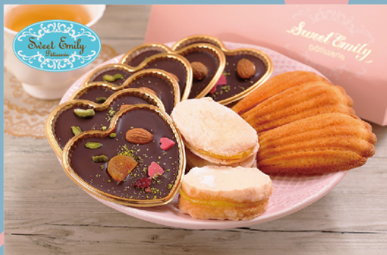
Sweet Emily 法式西點禮盒

規格：①法蘭西巧克力×6， ②金磚蛋糕×3，③達克瓦茲×3 熱量：①692大卡/100g，②480大卡/100g， ③513大卡/100g 保存期限：冷凍7天