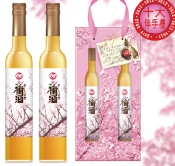
此商品無參加任選2件95折活動