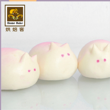
烘焙客 SoQ 雪兔包

規格：32g/顆×16 熱量：284大卡/100g 保存期限：-18°C冷凍1年