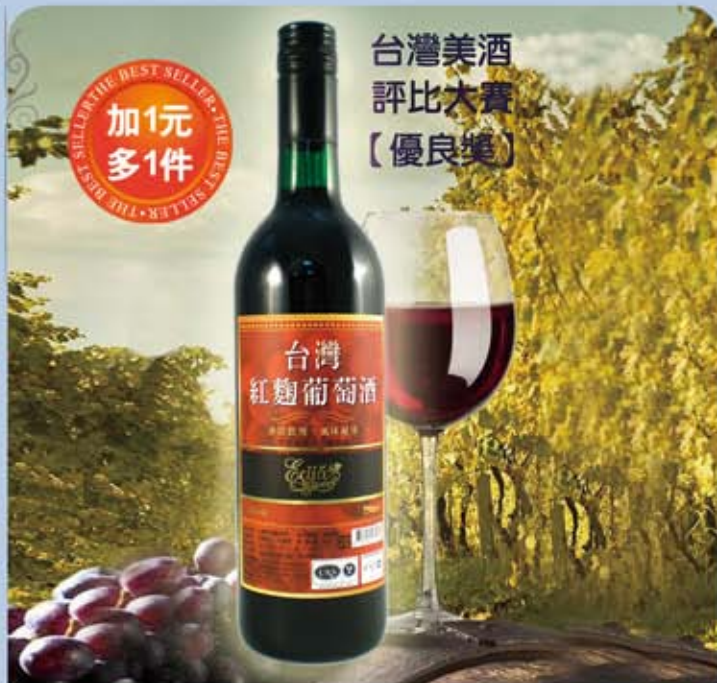
台灣紅麴葡萄酒 規格：750ml 保存期限：無期限