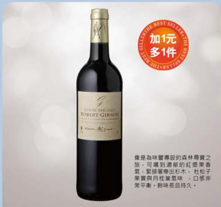
羅伯吉侯莊園特選紅酒 規格：750ml 保存期限：無期限