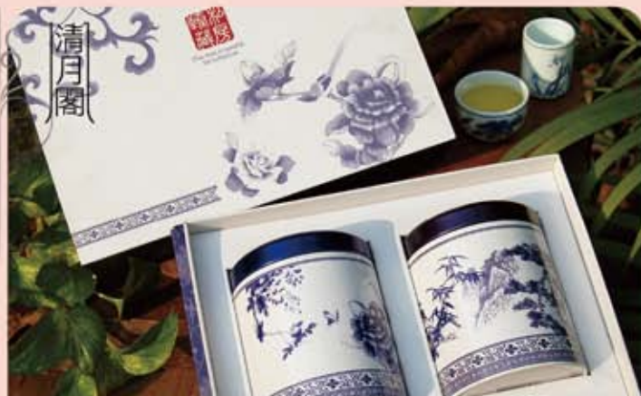
清月閣 阿里山手採高山茶 - 青花二兩雙罐禮盒

規 格：阿里山高山茶 75g*2 罐，單品重量 75g ± 5% 包裝規格：25X18X9cm 保存期限：36 個月 取 貨 日：7/10 起