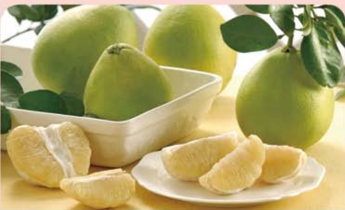
麻豆清泉果園 30 年老標特級文旦 (5 斤・10 斤)

規格：5 斤 6-8 顆, 10 斤 10-12 顆 包裝規格：5 斤 30X17X20.5cm / 10 斤 36X23X23cm 保存期限：20 天 取貨日：8/28-9/12