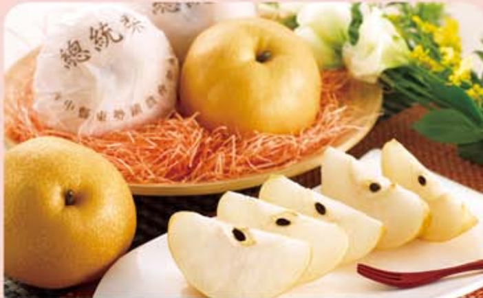
東勢區農會 總統梨水果禮盒

規格：豐水梨 17A(16.5~17.4 兩)*7 入 包裝規格：49X30X15cm 保存期限：10 天 取貨日：7/10 起