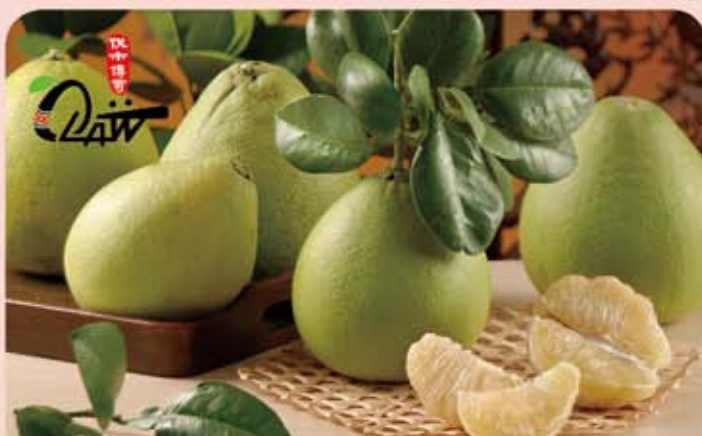
花蓮鶴岡 30 年老標特等文旦 (10 斤)

規格：10-12 顆 包裝規格：36X26X23cm 保存期限：20 天 取貨日：9/3-9/12