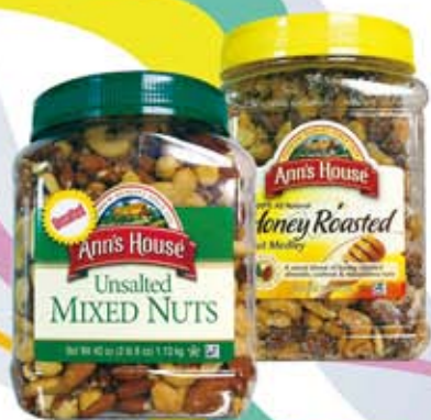
ANN'S 無調味綜合堅果 / ANN'S 蜂蜜綜合豆