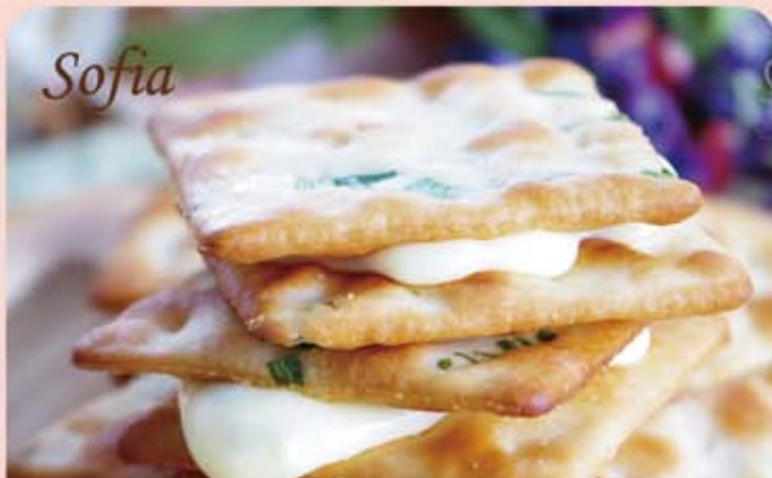
sofia 手感牛軋糖蘇打夾心餅乾

規格：40 片 / 盒 熱量：459.2 大卡 / 100g 保存期限：常溫 45 天