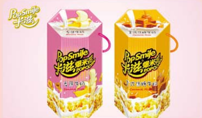
卡滋 焦糖 / 香蕉牛奶爆米花禮盒