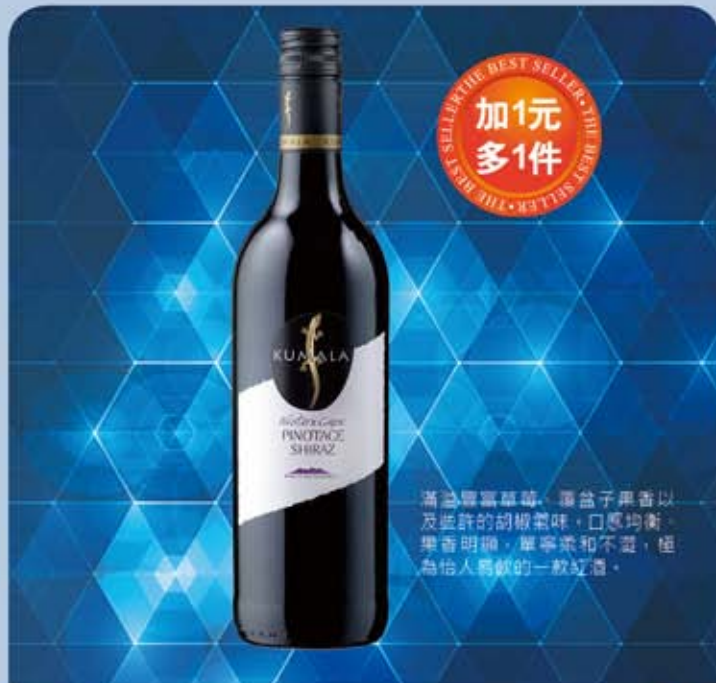
庫馬拉皮諾塔基希哈紅葡萄酒盒 規格：750ml 保存期限：無期限