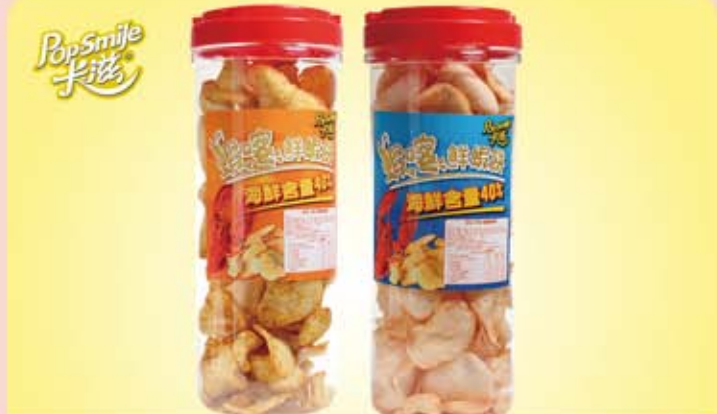
卡滋 蝦嗶鮮蝦餅 咖哩 / 起司

規 格：咖哩 110g(罐) / 起司 110g(罐) 保存期限：6 個月 取 貨 日：7/10 起