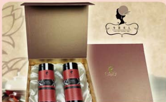
午茶夫人 經典時尚茶禮盒

規 格：太妃糖紅茶 *2 瓶 包裝規格：28.3X24.5X9.8cm 保存期限：24 個月 取 貨 日：7/10 起