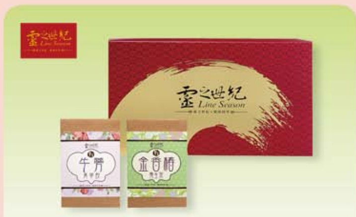
靈之世紀 牛蒡 & 金香椿養生茶禮盒

規 格：①牛蒡菁華養生茶 *8/1 盒，②金香椿養生茶 *8/1 盒 包裝規格：37.5X7.2X22cm 熱 量：① 11.6 大卡 /10g ② 2.4 大卡 /5g 保存期限：730 天 取 貨 日：7/10 起