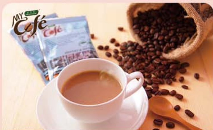
新源隆 怡保白咖啡二合一

規 格：怡保白咖啡 (2 合 1) 18g*36 小包 包裝規格：29X19X13cm 熱 量：88 大卡 /18g 保存期限：24 個月 取 貨 日：7/10 起