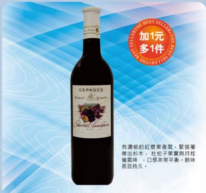
羅伯吉侯卡本內紅葡萄酒 規格：750ml 保存期限：無期限